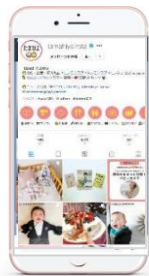
Instagram たまひよ公式 15.4万フォロワー