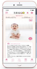
まいにちのたまひよ APP 45.3万MAU