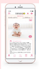
まいにちのたまひよAPP 47万MAU