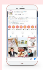
Instagram たまひよ公式 17.1万フォロワー