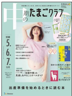
中期のたまごクラブ4C2PTU