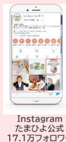
Instagram たまひよ公式 17.1万フォロワー