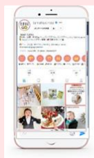
Instagram たまひよ公式 17.1万フォロワー