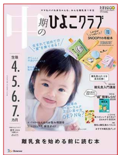
中期のひよこクラブ 4C2PTU