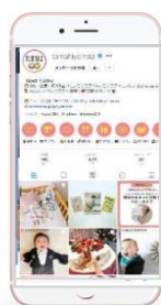
Instagram たまひよ公式 15.4万フォロワー