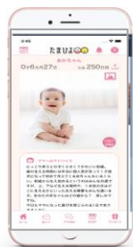
まいにちのたまひよ APP 45.3万MAU