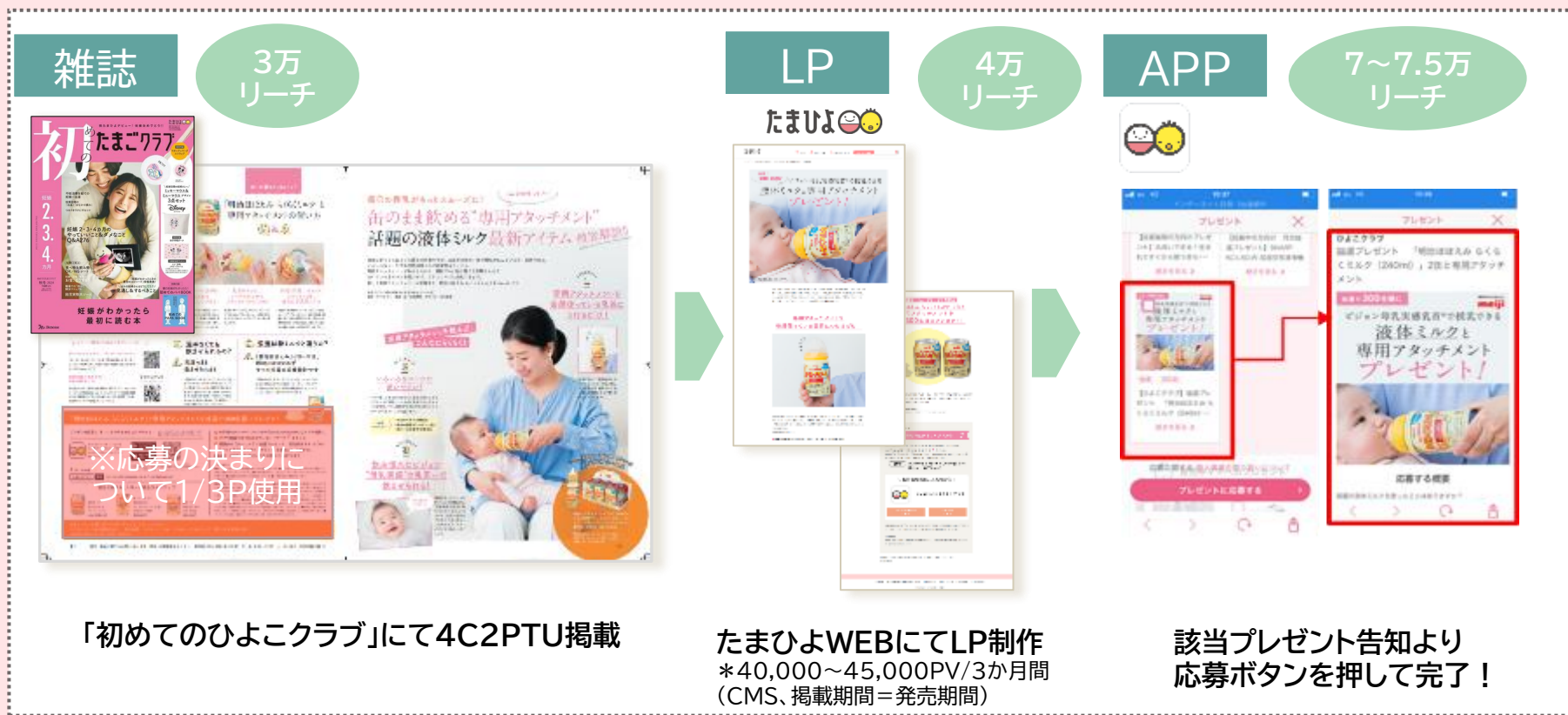
「初めてのひよこクラブ」にて4C2PTU掲載

※20名を超えるプレゼントをご希望される場合、配送実費のご負担をお願いいたします。 ※プレゼント応募者に対して、後日アプローチしたり、当選者に対して後日アンケートを取得することが可能です。 (別途オプション費用有。営業までお問い合わせください)