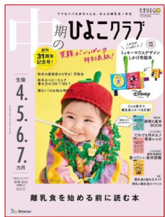
中期のひよこクラブ 4C2PTU