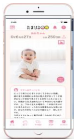
まいにちのたまひよ APP 45.3万MAU