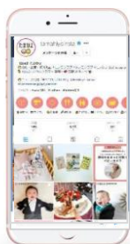
Instagram たまひよ公式 15.4万フォロワー